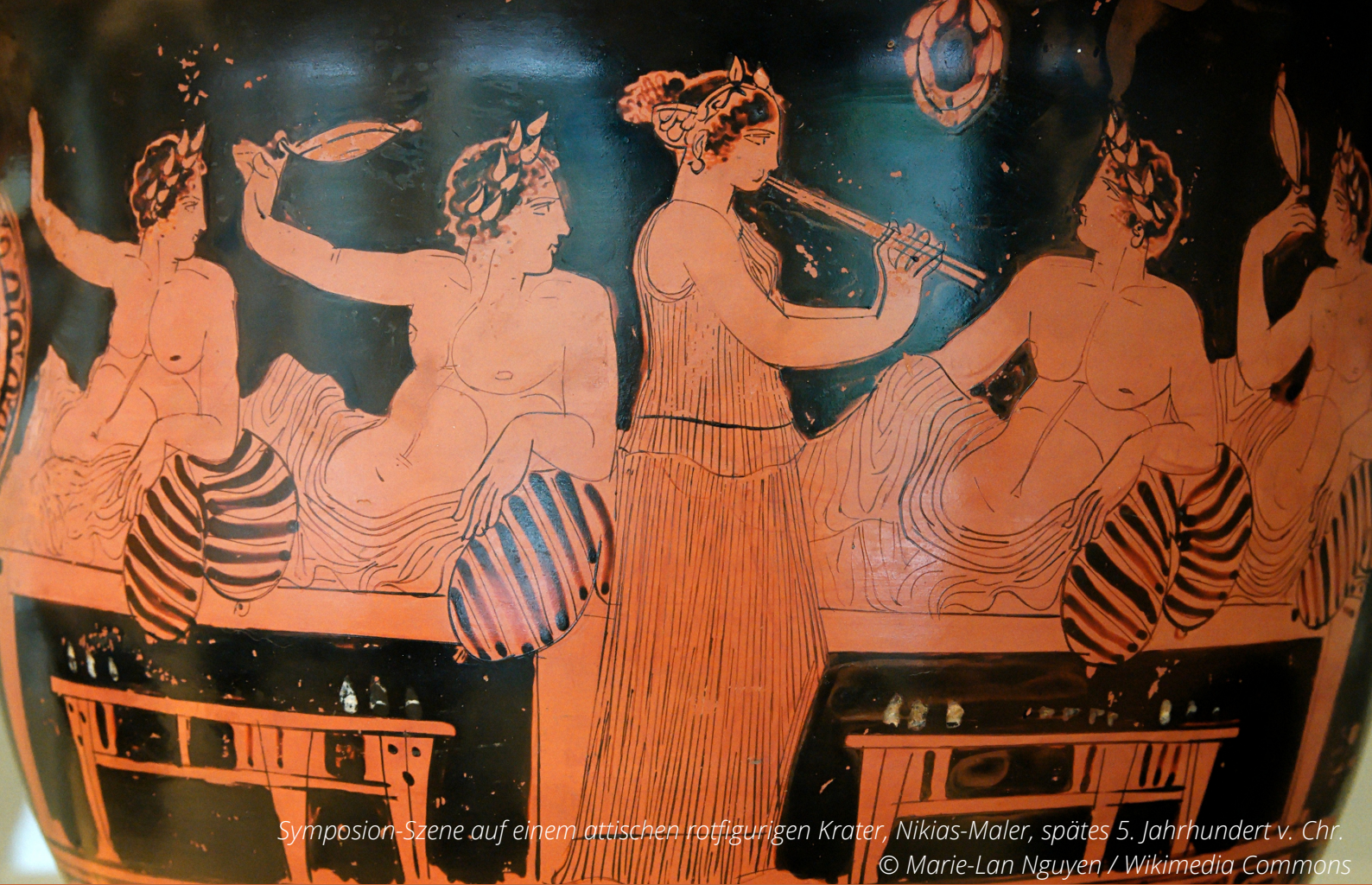
Symposion-Szene auf einem attischen rotfigurigen Krater, Nicias-Maler, spätes 5. Jahrhundert v. Chr.